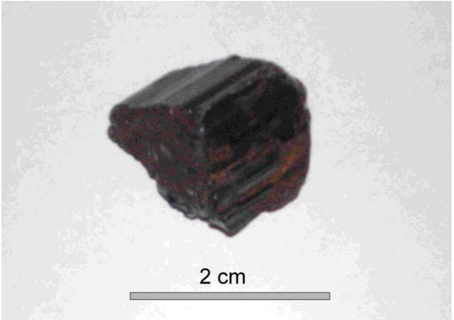
Foto 01: Tantalit/Columbit-Fragment von 8.5 g Gewicht, Projekt Johannes-Colonia

Calle Aruma 10, Urbari – Casilla 2341 Santa Cruz de la Sierra – Bolivia Phone: (+591) 3 3534669 | Fax: (+591) 3 3524790 Web: www.michaelbiste.com